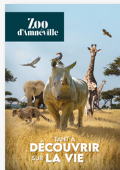
Affiche format A3 1 unité (29,7x42cm)