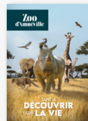
Affiche format A4 1 unité (21x29,7cm)