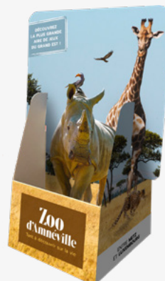
Présentoir pour dépliants 1 unité (24x11x7cm)